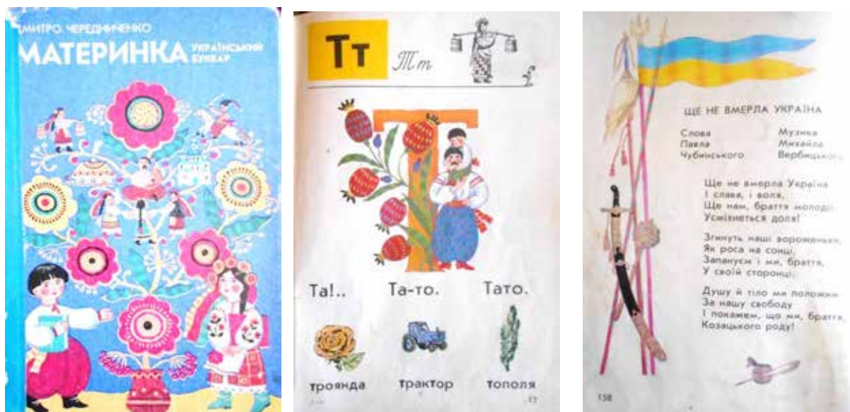
Рис. 1. Д.С. Чередниченко «Материнка. Український буквар» 1 клас, 1992 р. (Київ : Освіта): 1 – обкладинка підручника; 2, 3 – сторінки підручника

Національний колорит яскраво відображено в оформленні «Букваря» для першого класу авторів Н. Скрипченко, М. Вашуленко (1997) [7]. У візуальному ряді видання спостерігаються складні художні композиції,