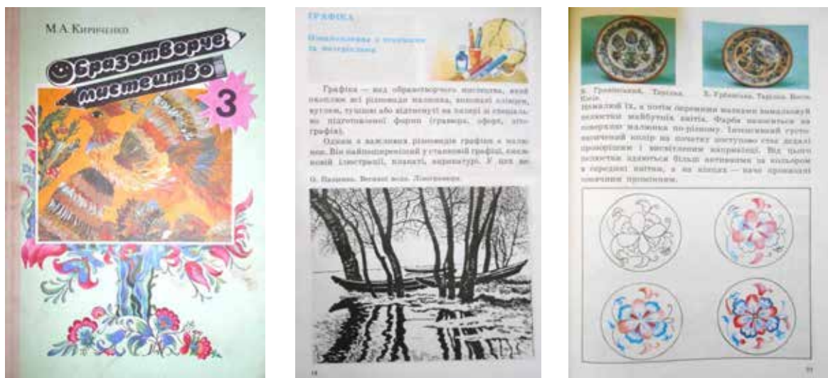
Рис. 6. М.А. Кириченко «Образотворче мистецтво» 3 (2) клас, 1992 р. (Київ : Освіта): 1 – обкладинка; 2, 3 – сторінки підручника