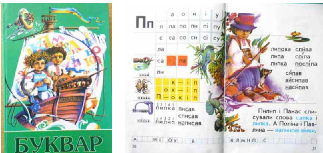
Рис. 2. Н.Ф. Скрипченко, М.С. Вашуленко «Буквар» 1 клас, 1997 р. 11-ге вид., перероб. (Київ : Освіта): 1 – обкладинка підручника; 2 – розворот підручника

Позитивним вважаємо збільшення кількості ілюстрацій, зміну їх ідеологічного й функціонального характеру: на відміну від