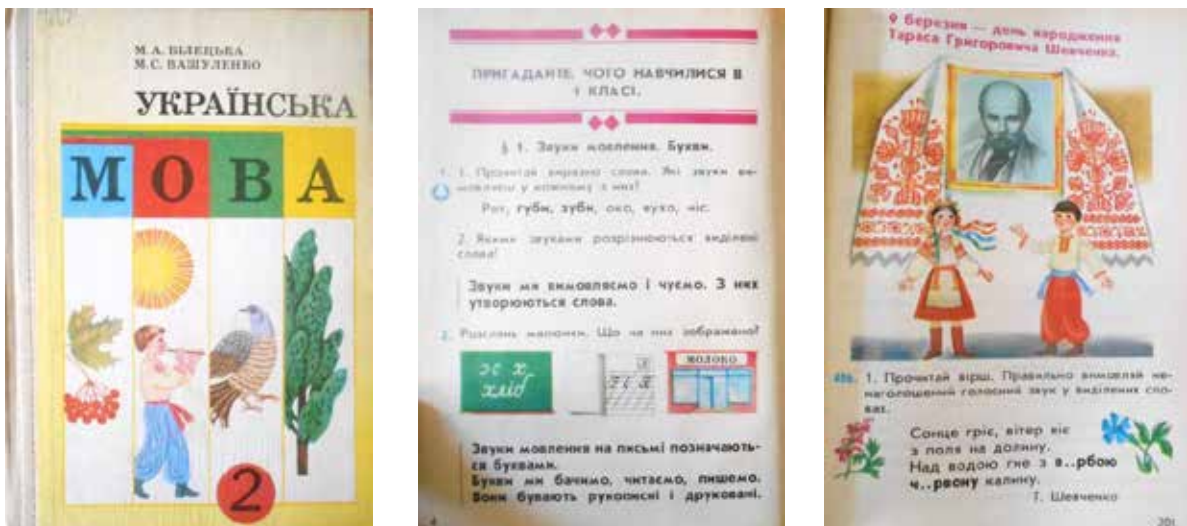
Рис. 3. М.А. Білецька, М.С. Вашуленко «Українська мова» 2 клас, 1991 р. 4-те вид., доп. і перероб. (Київ : Рад. школа): 1 – обкладинка підручника; 2, 3 – сторінки підручника

Підручники з математики представлені в основному виданнями М. Богдановича [2],