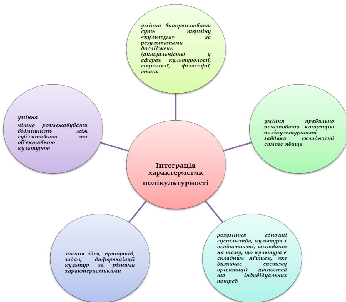
Схема 2. Інтеграція характеристик полікультурності вчителя-філолога у Польщі

Толерантність представляється як чинник нормального функціонування громадянського суспільства. У сучасному світі виховання терпимості у своїх громадян стало однією з головних цілей освітньої політики ліберально-демократичних спільнот. У 1995 році ЮНЕСКО прийняла Декларацію принципів терпимості, в якій говориться зокрема про те, що у школах і університетах, вдома і на роботі необхідно зміцнювати дух толерантності та формувати відносини відкритості, уваги один до одного і солідарності. У Декларації терпимість визначається як повага, прийняття і правильне розуміння багатого різноманіття культур нашого світу, форм самовираження і способів проявів людської індивідуальності. Можливість правильно інтерпретувати і розуміти суть культури та полікультурності маємо, якщо вчитель інтегрує характеристики, відображені на схемі