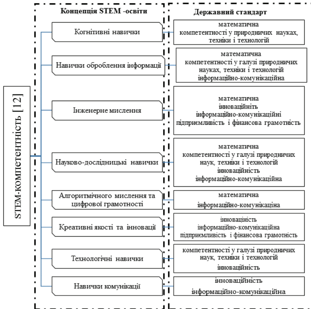
Рис. 2. Порівняльний аналіз складових елементів STEM-компетентності