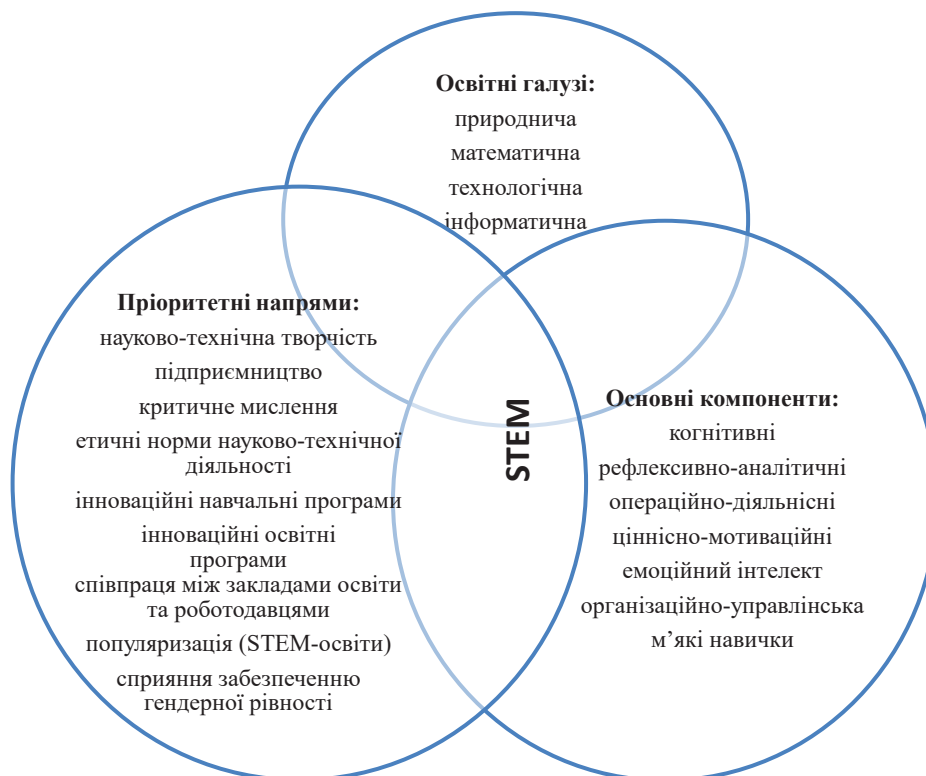
Рис. 1. Складові елементи (освітні галузі, пріоритетні напрями й основні компоненти) природничо-математичної освіти (STEM-освіти)

Проведений аналіз свідчить про відсутність у нормативних документах цілісного