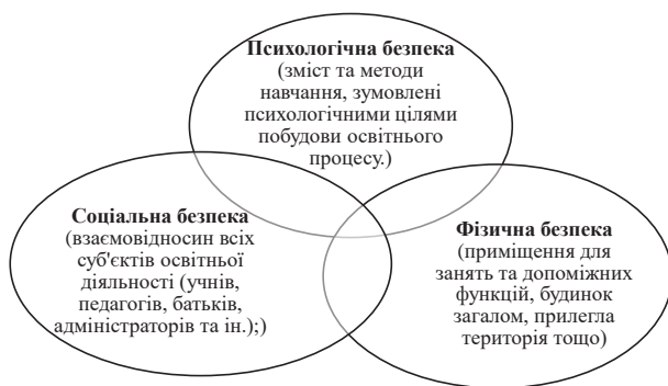
Рис. 1. Компоненти безпечного освітнього середовища закладу дошкільної освіти (складено автором)

У даному дослідженні будемо розглядати безпечне освітнє середовище освітньої установи як сукупність умов, які сприяють запобіганню та превенції фізичних, психологічних, інформаційних, соціальних, матеріальних загроз всіх суб'єктів освітнього процесу, захищаючи їх від негативних впливів та сприяючи їх розвитку. Таким чином, поняття «безпека освітнього середовища закладу дошкільної освіти» включає в себе наступні компоненти: фізична безпека, психологічна безпека, соціальна безпека (рис. 1).