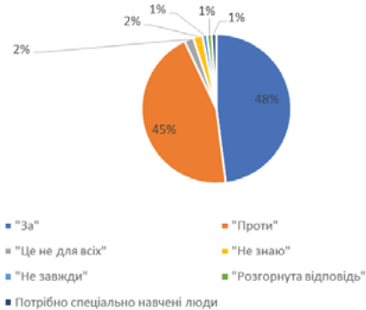
Рис. 3. Розподіл відповідей на питання «Чи варто використовувати арттерапію для виправлення клієнтів Центру пробації?»

Чи варто використовувати арттерапію для виправлення клієнтів Центру пробації?