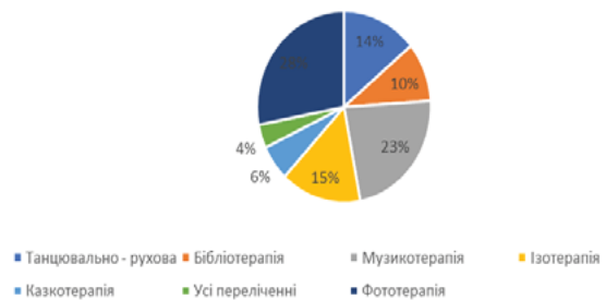
Рис. 5. Розподіл відповідей на питання «Якби Ви мали можливість пройти навчання по певному з методів арттерапії, який би ви обрали?»

Якби Ви мали можливість пройти навчання по певному з методів арттерапії, який би ви обрали?