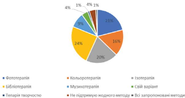
Рис. 4. Розподіл відповідей на питання «Який саме метод арттерапії Ви вважаєте найдоречнішим для роботи з клієнтами Центру пробації?»

Який саме метод арттерапії Ви вважаєте найдоречнішим для роботи з клієнтами Центру пробації?