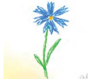
Рис. 7. Виконання методики «Автопортрет» (Дівчина В.)

замислитися. Друга методика «Автопортрет» рекомендується в арттерапії для прояву особистісної ідентичності. Це провокативна методика, де ми очікуємо від клієнта не справжнього автопортрету, а метафоричного зображення клієнта (рис. 7).