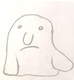
Рис. 8. Виконання методики «Як мене бачить світ» (Дівчина В.)

квітка ніби зависає в просторі. Час реалізації малювання: 20 хвилин. Питання для обговорення: Чи подобається зображення? Яка це квітка? Чи знає вона з чим асоціюється ця квітка в українській культурній традиції? Чому Вона уявляє себе у вигляді волошки? Майбутні перспективи у роботі: Продовжити виконання методик на самоспостереження, самопізнання, самоаналіз. Висновки заняття: Методика дає можливість клієнту розібратися в собі. На завершення заняття клієнтка виконує методику «Як мене бачить світ?» (рис. 8).