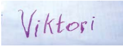
Рис. 6. Виконання методики «Намалюй своє ім'я» (Дівчина В.)

нам подати і охарактеризувати всі продукти творчості учасників занять. Але хотілося б зупинитися на деяких роботах Дівчини В. Першою з діагностично-ознайомлювальних методик є методика «Намалюй своє ім'я» (рис. 6).